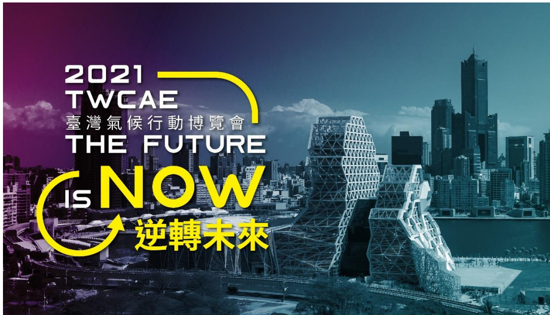
圖、博覽會主視覺示意圖